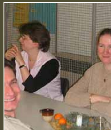
Stimmung bei der Feier