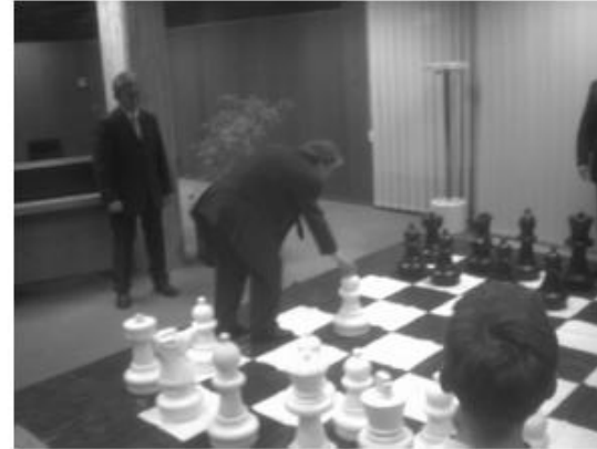
symbolischer Eröffnungszug (Orang-Utan)