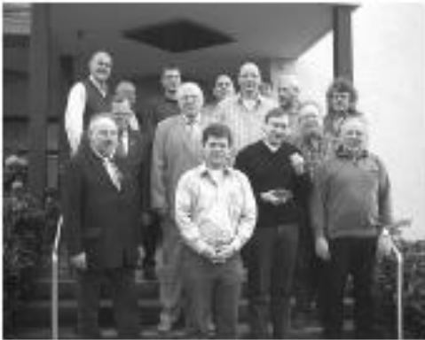
aktuelles DSB Präsidium