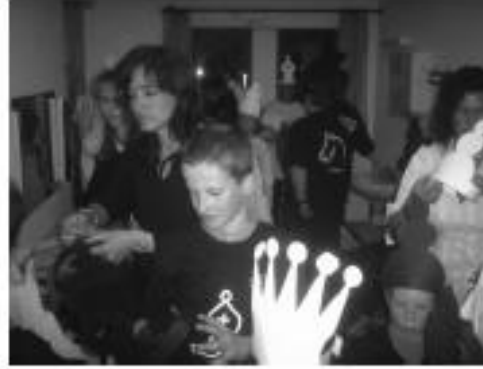
hinter den Kulissen