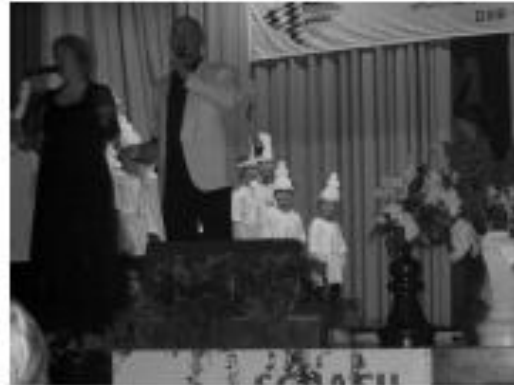
Gesangsduo mit "Chess"