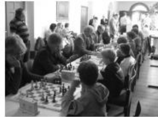
Jugend spielt für Olympia