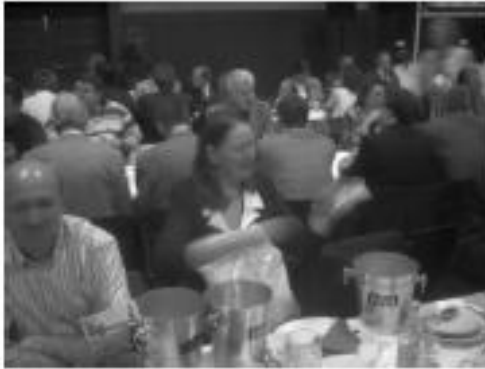
Vorbereitung der Lose