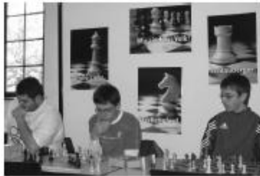
... die Jugendgruppe