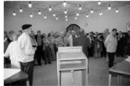
Empfang im Rathaus