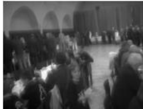
Schlacht am Buffet