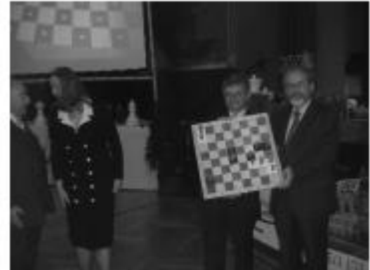
Geschenk Stadt Pfullingen